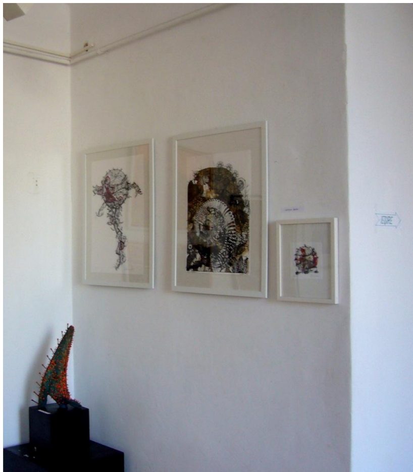
Letitia Gaba/ grafica