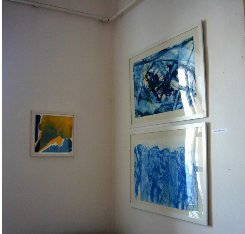
H. Biermann/ pictura (Foto: IKV)